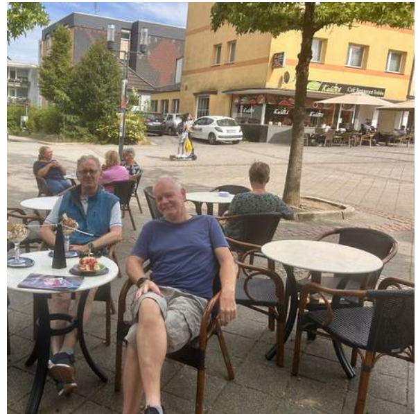
Und zum Schluß noch ein leckeres Eis in Heiligenhaus