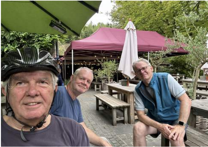
Ein Bierchen an der Auermühle