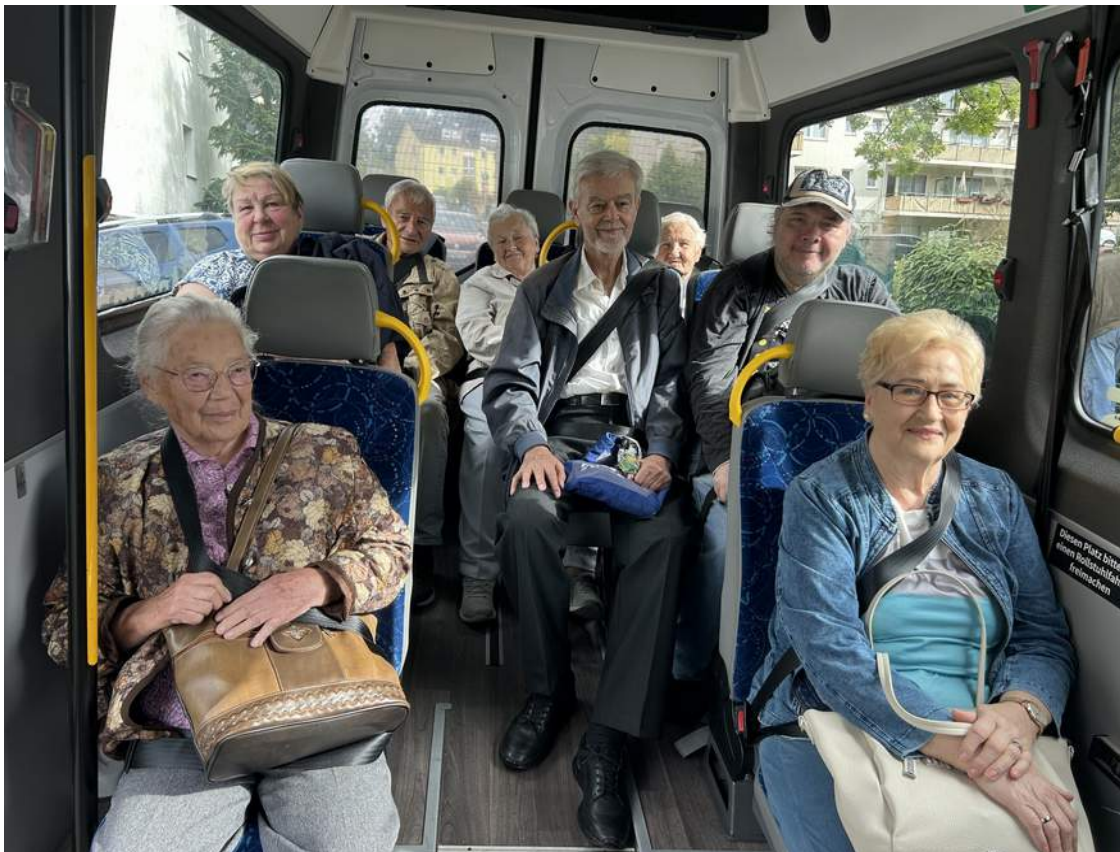
Der Bus ist voll besetzt!

„Die Fahrer sind immer freundlich und gehen Dir gerne zur Hand! Kommst Du mit Rolli und Trolli, gehen sie Dir zur Hand! Bedanken woll'n wir uns mal gerne, hier mit diesem Lied, wir sind froh Euch zu haben, Danke dafür, dass es Euch gibt!“